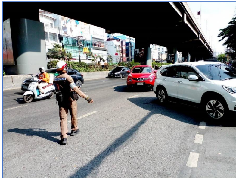
วันที่ ๑๗ พฤศจิกายน ๒๕๖๗ เวลา ๑๖.๐๐ น. ร.ต.ท.สมพร ลุณหงส์ รอง สว.(จร.) สน.บางยี่ขัน อำนวยความสะดวกจราจร บริเวณหน้าห้างสรรพสินค้าเซ็นทรัล ปิ่นเกล้า